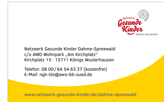
Alternative: Vorderseite neutrale Visitenkarte (Nutzung für verschiedene Personen im Regionalnetzwerk – Name und ggf. Mobilnummer etc. können handschriftlich ergänzt oder eingestempelt werden)