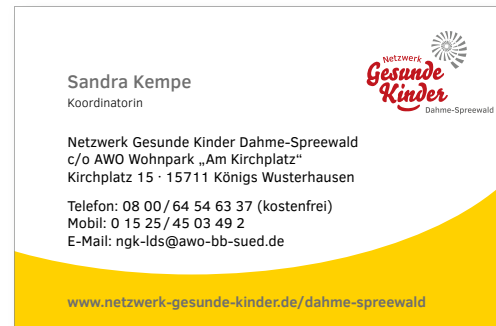
Vorderseite personalisierte Visitenkarte (Standard)

Personalisierte Karten wirken seriöser und sollten bevorzugt eingesetzt werden – zumindest von Personen, die sie häufiger benötigen. Wo das nicht praktikabel ist, kann auf die neutrale Form ausgewichen werden.